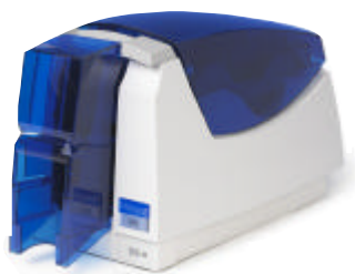
La petite imprimante Datacard® SP35 offre un mélange idéal de vitesse, de simplicité, d'élégance, et d'économie.

L'imprimante SP35 personnalise jusqu'à 120 cartes par heure en couleur et jusqu'à 500 cartes en monochrome. Non seulement la machine a une cadence de