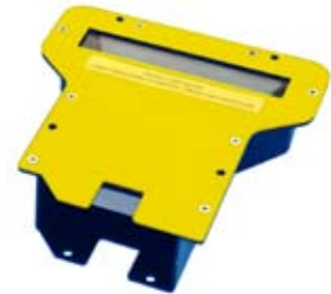
Miroir courte distance de lecture