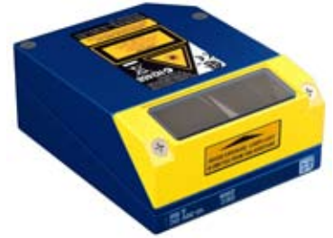
Miroir de renvoi pour les zones restreintes